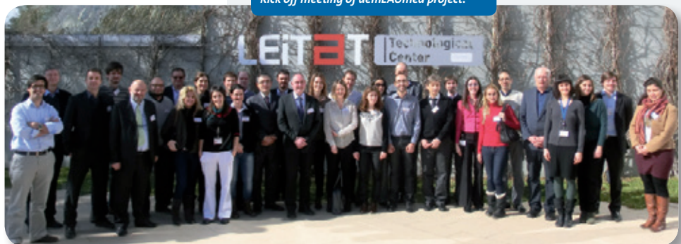
Kick-off meeting del proyecto demEAUmed Kick off meeting of demEAUmed project.

This document has been produced with the assistance of the European Union (Grant agreement N° 619116). The contents of this document are the sole responsibility of the demEAUmed Consortium and can in no way be taken to reflect the views of the European Union.